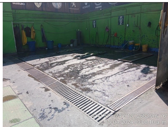
Foto No.4. Área de lavado y rejillas perimetrales