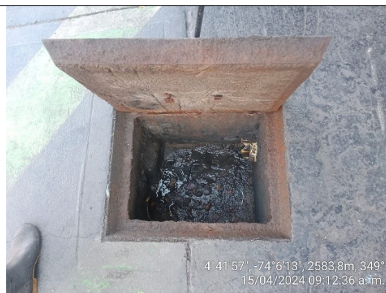
Foto No.6. Caja de Inspección Externa