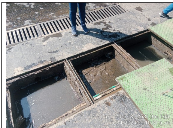
Foto No.5. Trampa de grasas