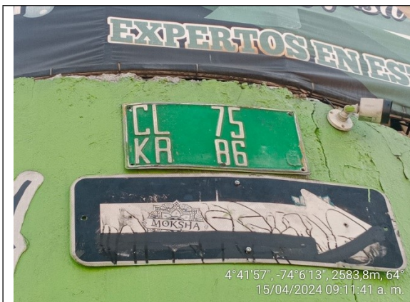
Foto No.3. Nomenclatura